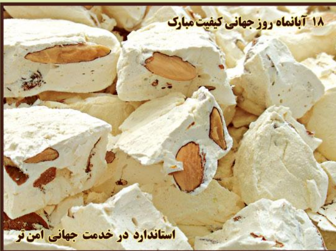
۱۸ آبانماه روز جهانی کیفیت مبارک